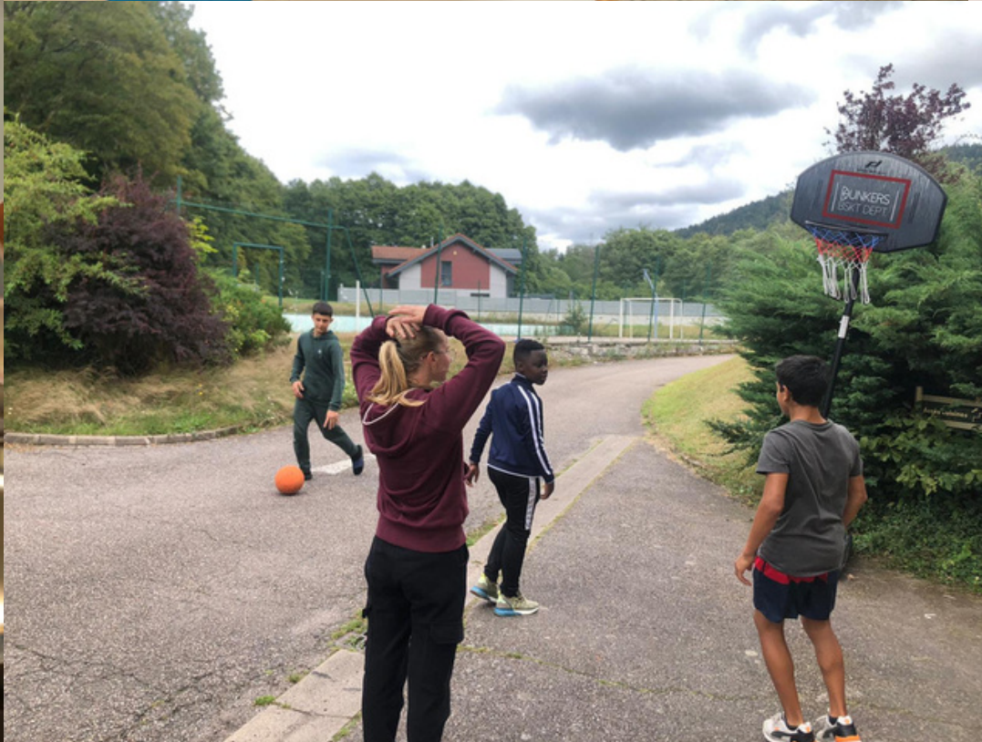
Le fameux panier tordu